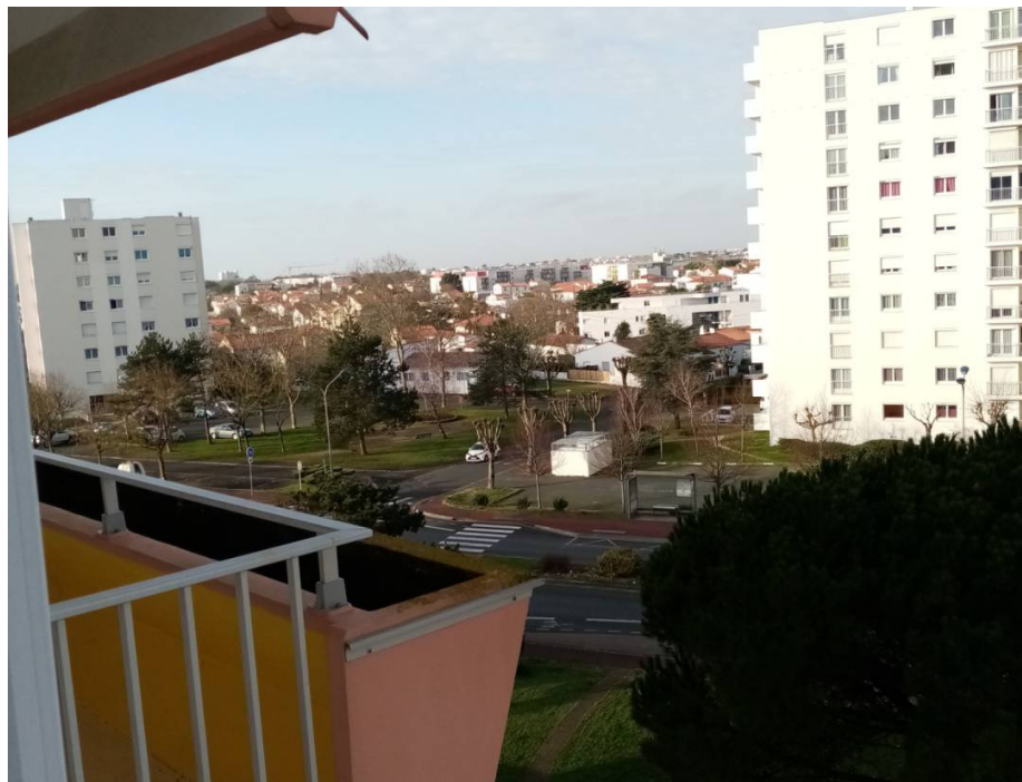
Balades à pied et à vélo.

Cap ouest viager vous propose en exclusivité : VENTE EN NUE PROPRIETE OCCUPE par un couple, une Dame de 76 ans et un Homme de 73 ans .Situé sur la commune de ROYAN, dans une petite résidence avec ascenseur., un appartement T3 de 61m 2 situé au 3ème étage, comprenant : entrée avec placards, séjour lumineux donnant sur une Balcon (6m 2 ) orienté sud/Ouest avec vue dégagée, cuisine fermée aménagée, deux chambres, salle d'eau, WC - Place de parking extérieur- cave- Chauffage individuel électrique - Ravalement refait en 2014 Menuiseries Pvc.