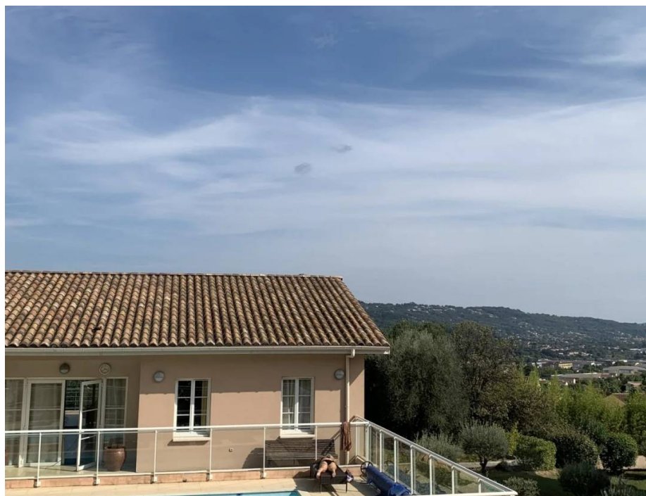
GRASSE - Chemin des Arômes - Les Séniories

dont 153 € € de provision pour charges - régularisation annuelle