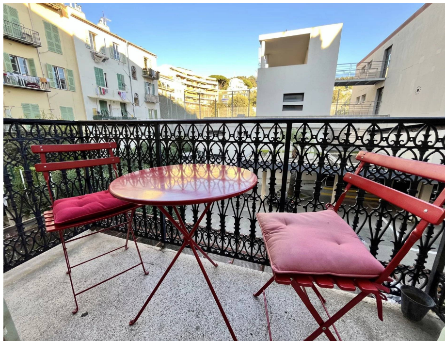
Nice, Le Port - Bd Stalingrad

Charges locatives au réel : remboursement sur justificatifs